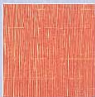
VJ - 0001