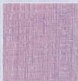
VJ - 0005