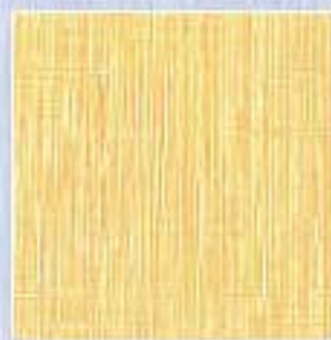
VJ - 0007