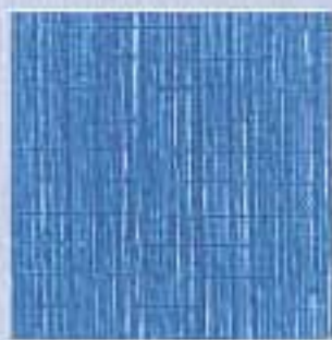
VJ - 0004