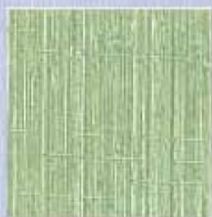
VJ - 0002