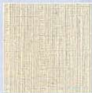
VJ - 0006