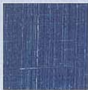
VJ - 0003