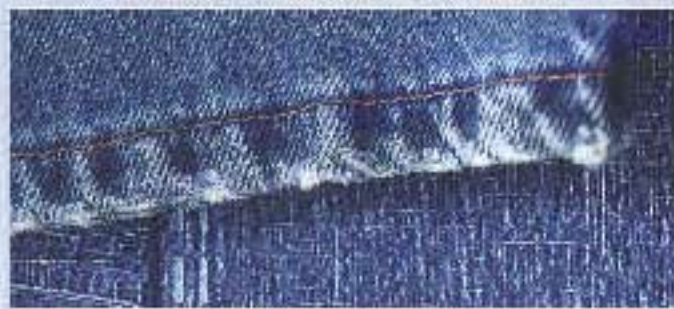
VJ - 0008